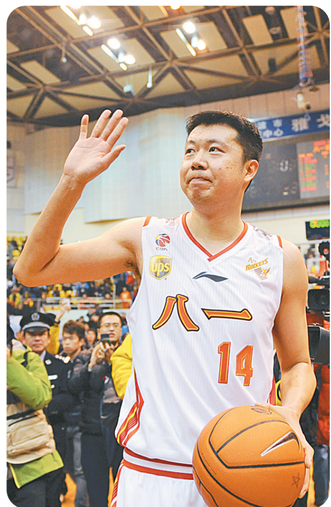
昨晚的宁波，本赛季CBA常规赛最后一轮，八一双鹿不敌辽宁队，结束了本赛季的征程，王治郅也由此结束了自己的职业球员生涯。一代传奇就此谢幕。

索契冬奥会赛程昨日过半。假如用两个关键词来总结中国冰雪军团的半程之旅，恐怕突破和坚守较为贴切。 突破来得突然，坚守却是必然。一切来得那么突然，而且集中在2月13日发生。当日下午在短道速滑女子500米比赛中，27岁的李坚柔用冠军捍卫了中国在这个项目上的传统，取得了中国代表团在本届冬奥会上的首枚金牌，也为中国队实现了该项目的冬奥“四连冠”。距离这枚金牌仅仅3个小时，名不见经传的张虹以1分14秒02的成绩滑完了1000米的距离，实现了索契冬奥会中国冰雪健儿10届冬奥会、34年的速滑金牌梦。 在中国代表团副团长肖天看来，大道夺金是历史性重大突破，短道金牌更是整体实力的体现。 “大道速滑是冬季运动里举足轻重的项目，这是一枚非常有分量的金牌，是历史性的重大突破。”李坚柔的幸运背后有中国队的整体实力，她的夺冠是偶然之中的必然。 肖天的点评基于中国军团的实际。三天之后，霸气周洋突破韩国强劲对手围剿，成功卫冕短道速滑女子1500米金牌，成为该项目2002年进入冬奥会以来卫冕第一人。周洋说：“一块(冬奥会)金牌远远不够。” 赛程过半之时，中国军团获得的三枚金牌已经超过温哥华冬奥会同期。 突破不仅仅在速滑，也在男子冰壶；坚守也不仅仅在短道，也在自由式滑雪空中技巧。 在索契，中国男子冰壶队一开始就势如破竹，连续四连胜。截至2月16日，中国男子冰壶已经取得6胜1负的成绩，暂时和瑞典队并列第一，只要再胜一场即可确保四强席位。 要知道在温哥华，中国男子冰壶在冬奥会的处女秀中的成绩是2胜7负名列第八。 自由式滑雪空中技巧一直是中国的传统优势项目。在2月14日索契冬奥会女子空中技巧比赛中，中国有三名运动员杀入决赛，两人进入前四，中国队强大的整体实力体现无余。中国队的主将徐梦桃再次为国争光，夺得银牌，这是自长野冬奥会以来，中国队获得的第四枚女子空中技巧银牌。自由式滑雪本身就是偶然性非常大的项目，中国队要获得金牌只差那么一点点运气。 值得提及的是包括老将李妮娜在内的所有运动员并没有将目光只放在金牌上，在决赛中，她们都向高难度动作发起了冲击。赛后有记者问李妮娜，为何不在最后一轮中选择相对简单的动作以求稳妥。她说，在决赛中跳一个难度低的动作没有意义，对于所有参赛运动员来说，每个人都会拿出自己最难的动作。 肖天对李妮娜们对更快、更高、更强的奥林匹克精神的追求表示赞赏。他说：“尽管比赛有些遗憾，但是结果可以接受。特别是李妮娜作为老运动员，在最后时刻还是想冲一下，上这么高的难度。虽然最后有些失误，摔得很重，但这种精神值得尊敬。” 半程中，还有许多时刻值得铭记。无论是宁琴的雪上初试还是庞清/佟健的深情谢幕，无论是韩天宇的“意外”夺银还是王北星的坚韧努力，这些都将成为经典记忆。 索契冬奥会赛程还将进行8天，中国军团还将延续突破和坚守之旅，不断发扬奥林匹克精神，争取更多荣光。 新华社记者 周杰 江红 邹大鹏