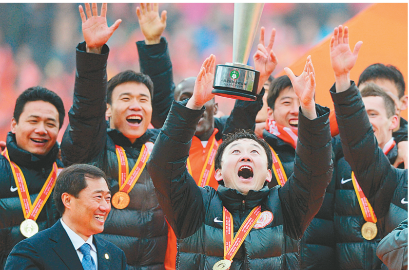
2月16日，贵州人和队球员在颁奖仪式上庆祝夺冠。当日，在2014中国足协超级联赛中，贵州人和在主场贵阳奥体中心以1:0战胜广州恒大，获得冠军。

本报讯(记者 陈凯)昨日，记者从省球类运动管理中心获悉，本赛季全国女排联赛升降级挑战赛赛程已经正式公布。本月23日，河南鑫苑女排将远赴玉溪与云南女排展开挑战赛首场较量。值得一提的是，这也是两队连续第三个赛季在升降级挑战赛中相遇。前两次交锋中，河南女排均战胜对手成功晋级。 另据了解，本赛季女排挑战赛将采用三场两胜制，参加资格赛的队伍先拥有一个主场，剩下的两场比赛在参加联赛的队伍主场举行。本月23日客场云南之后，河南女排将分别于本月27日和28日坐镇漯河体育中心体育馆迎战挑战赛两个主场之战。