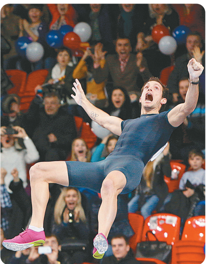
2月15日，法国选手拉维勒尼下落的过程中仰望纹丝不动的横竿。当日，在乌克兰顿涅斯克举行的一项国际室内田径大奖赛中，拉维勒尼以6米16打破了“撑竿跳沙皇”布勃卡保持了21年的男子室内撑竿跳世界纪录。 值得一提的是，21年前布勃卡创造6米15世界纪录的地方，正是这同一块场地，布勃卡本人当天也出现在比赛现场，并在赛后亲自为拉维勒尼颁奖。 撑竿跳高的室外世界纪录同样属于布勃卡，不过那个数字是6米14，室内世界纪录比“正式”的室外世界纪录还要高，这相当罕见，所以拉维勒尼现在已经是名副其实的撑竿跳高“第一人”了。