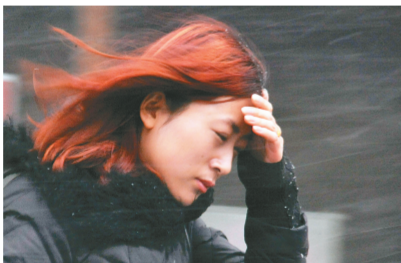
绿城市民冒雪前行。

在岗坡一家农贸市场走访,西红柿和黄瓜的零售价为每斤5元,小青菜、生菜等叶类蔬菜的价格多在每斤3.5元至4元。“受天气影响,部分蔬菜价格小幅上扬。”一家蔬菜商户告诉记者,前几天的那场大雪,蔬菜受到的波及比较大,一般蔬菜价格动辄都是六七元一斤。同时,不少商户坦言,和往年相比,今年春节前后的蔬菜价格还是相对比较低的,“暖冬的原因,很适合蔬菜生长,供应的蔬菜量很大,价格自然会降下来,雨雪天价格上扬,也只是短暂的。”