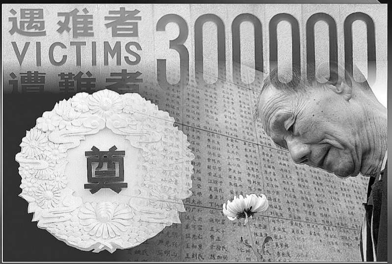
新华社记者 冯琦 编制