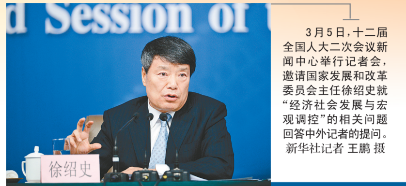
3月5日，十二届全国人大二次会议新闻中心举行记者会，邀请国家发展和改革委员会主任徐绍史就“经济社会发展与宏观调控”的相关问题回答中外记者的提问。徐绍史表示，今年将努力保持物价总水平基本稳定，总结完善阶梯电价，指导落实阶梯水价，适时出台阶梯气价政策。