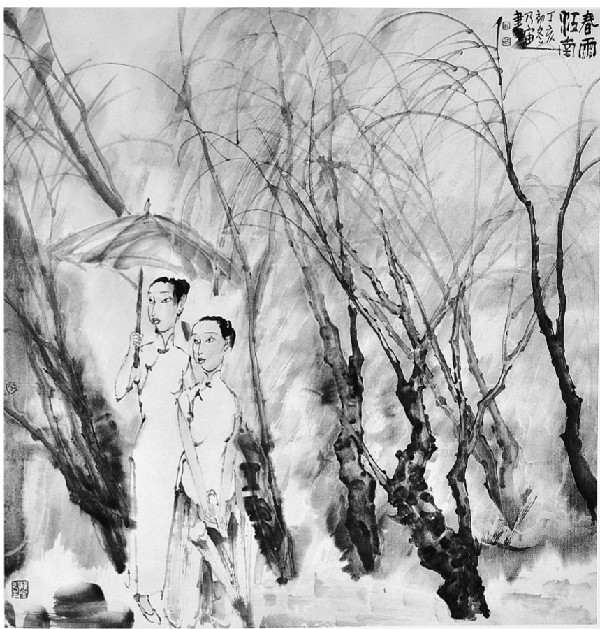
春雨江南(国画) 李乃宙

杜甫不仅种药,而且还会加工炮制中草药,懂得药性、药理,会治常见病、多发病。“晒药能无妇,应门亦有儿。”他除了自己身体力行外,还发动妻小晒药制药。公元759年,杜甫因生活所迫移居成都,并在那里修建了草堂一栋。在成都草堂,他广植花树,遍种药草,“种竹交加翠,栽桃烂熳红”,把草堂点缀得繁花斗艳,充满生机。正如他在《小园》诗中说的:“客病留因药,春深买为花。”可见杜甫种花既为观赏,又为入药治病。