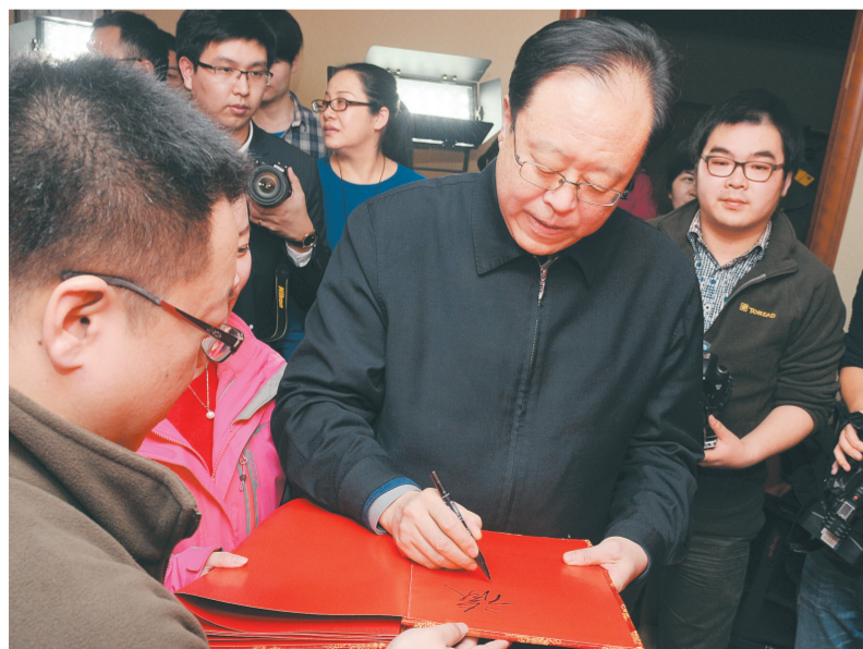
马懿:读晚报看郑州