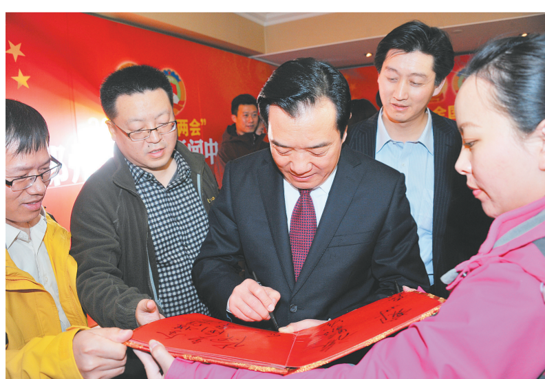
白红战:全媒体宣传 多角度解读