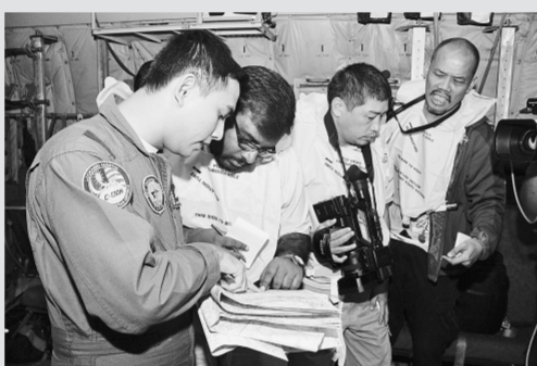
3月13日,在马来西亚苏邦军用C130运输机上,记者向马来西亚空军了解情况。