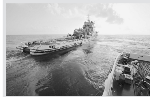
3月13日,南海救101轮与南海救115轮分离,继续在疑似海域开展搜寻。