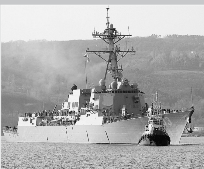
3月13日,美国“特拉克斯顿”号导弹驱逐舰进入保加利亚黑海港口瓦尔纳。

据俄罗斯媒体12日报道,应乌克兰克里米亚自治共和国邀请,俄议会上下两院将派代表团前往克里米亚监督当地全民公决进程。美国总统奥巴马12日重申,不接受乌克兰克里米亚自治共和国即将举行的全民公决。 法国总统奥朗德12日与俄罗斯总统普京通电话,要求普京尽一切努力避免乌克兰克里米亚并入俄罗斯。 乌克兰议会13日表决通过一份呼吁书,请求联合国立即研究乌克兰克里米亚自治共和国目前局势。