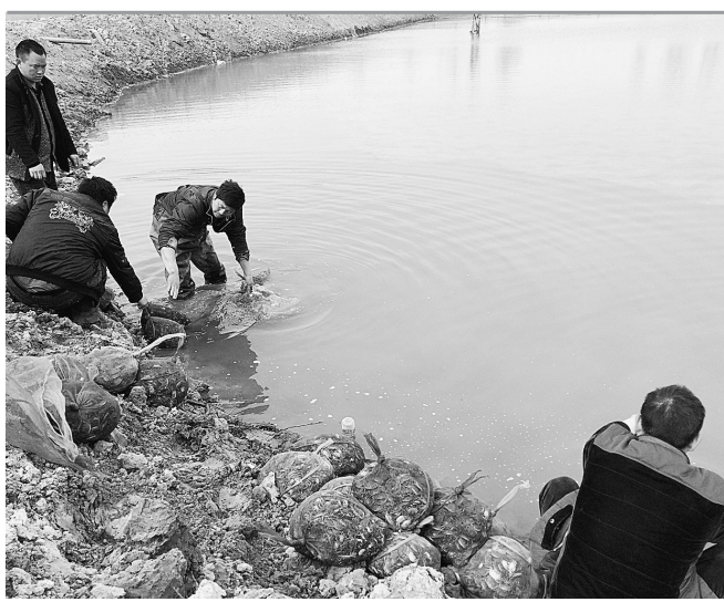
搬运工人将长江蟹苗小心翼翼地放入水中。

据悉,此次引进的长江蟹苗共11000斤,每斤100只左右,现在投入蟹苗,预计农历八月底上市,保守估计40%的成活率,预计产量20万斤。长江蟹的特点是腿长肉紧,个儿大,但成熟期较晚。 雁鸣湖镇的水产养殖主要是三大块:鲤鱼60%~70%、蟹20%、甲鱼10%。全镇现在有大闸蟹养殖面积1100亩,养殖户20户,明年养殖面积准备扩大到1万亩。现在的养殖模式是公司加农户的合作社模式,全镇养殖进行统一采购蟹苗、统一养殖、统一销售,打造雁鸣湖大闸蟹品牌。