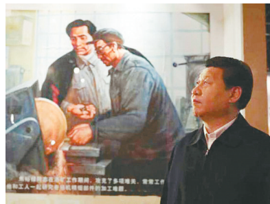
新华网北京3月17日电 春暖花开时节,中原大地充满生机。习近平17日来到他在第二批群众路线教育实践活动中的联系点——河南兰考县。兰考是“县委书记的榜样”焦裕禄工作过的地方。一下车,他就直接来到焦裕禄同志纪念馆。2009年4月,习近平曾来兰考参观焦裕禄事迹展,并种下一棵泡桐。

我是来学习的 焦裕禄精神是永恒的 把老百姓看成父母 为民服务不能一阵风 党一刻也离不开百姓 对照自己 见贤思齐