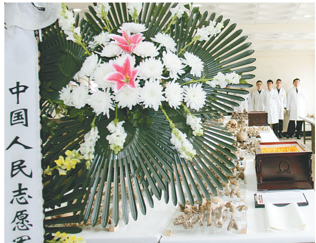
3月17日,在韩国京畿道的坡州市,韩方工作人员准备安葬在中国人民志愿军烈士的遗骸。

据新华社电 韩国国防部17日在京畿道坡州市举行了437具中国人民志愿军烈士遗骸安葬仪式。这些志愿军烈士遗骸计划在月底被送回中国重新安葬。