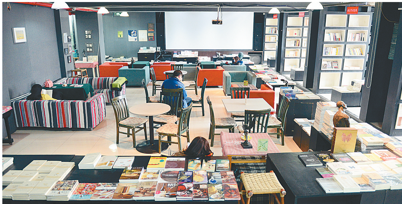
“城市之光”书店内景