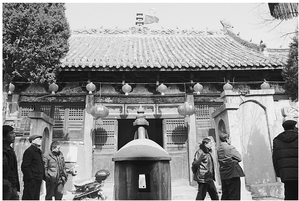
洪山村村就是以这座洪山庙得名。