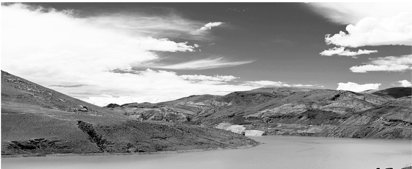
高原风光

油菜花儿开，不着杂色，鲜黄一片，明亮悦目，俏丽端庄。走进她，触摸她，感悟她，朴实憨厚，自由奔放。