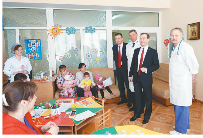
3月31日,在克里米亚首府辛菲罗波尔,俄罗斯总理梅德韦杰夫(右二)访问一家儿童医院。俄罗斯总理梅德韦杰夫当日抵达克里米亚访问,宣布当地将建立经济特区,承诺改善民生和基础设施。