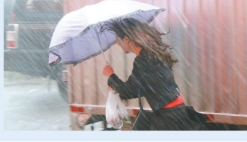
3月31日上午,在广东汕头街头,一名女子在暴雨中出行。

据新华社广州3月31日电(记者 吴涛 赖雨晨 史雷萌)广东省遭遇大范围的雷雨大风、强降水和冰雹天气,强度大、灾种多。从28日至31日,广东省约7.7万平方公里的面积上出现大暴雨以上降水,局部出现特大暴雨。来自广东省民政厅的数据称,截止到3月31日17时,强降水和风雹灾害已造成该省11人死亡,3人失踪,14人因灾伤病。据统计,广东省此次受灾共有深圳、佛山、惠州、东莞、中山、肇庆、云浮7个市的9个县、36个乡镇,受灾人口3.45万人;紧急转移安置2290人;倒塌房屋49间、严重损坏378间。广东省气象首席预报员林良勋说,28日以来,广东出现了今年以来最强的强对流和强降水天气,珠三角和云浮、清远、河源等市县普降大暴雨,局部特大暴雨,广州增城、萝岗等地还出现12级以上瞬时大风。此轮天气范围大,灾种多。“这次暴雨范围极其之广,广东省有13个市、约7.7万平方公里的地方出现了雷雨大风、强降水和冰雹等天气,广州市一天之内出现两次冰雹。这也是广东省前汛期十年以来,首次同时出现大范围强降水、雷雨大风、冰雹和短时强降水等多灾种天气。”林良勋说。广东省重大气象灾害应急办公室在30日16时启动气象灾害(暴雨)三级应急响应。在5个半小时后,也即30日21时30分又紧急提升为气象灾害(暴雨)二级应急响应。持续的暴雨给深圳机场造成重大影响,两天内共取消300多个航班,仅31日就取消出港航班118个,数千名旅客受到影响。一些延误的旅客情绪激动,出现了霸占柜台、打砸办公用品、阻挡其他旅客登机的现象。深圳30日晚发布暴雨红色预警信号,这是当地自2008年以来的首次。