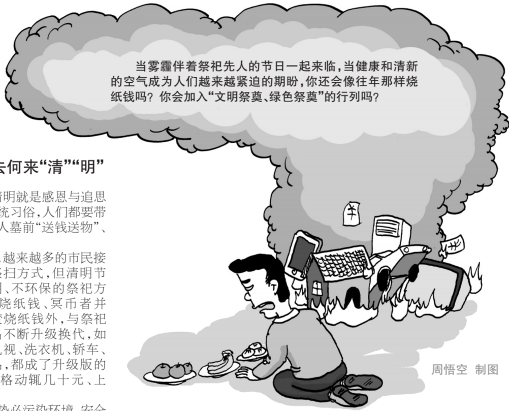
当雾霾伴着祭祀先人的节日一起来临,当健康和清新的空气成为人们越来越紧迫的期盼,你还会像往年那样烧纸钱吗?你会加入“文明祭奠、绿色祭奠”的行列吗?