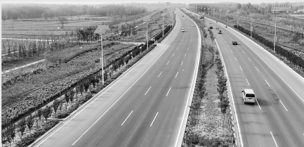
郑新快速通道旁花草共舞成美景。