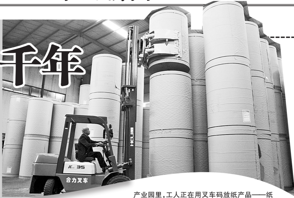
产业园里，工人正在用叉车码放纸产品——纸杠。每个纸杠重两吨，用于制作高档纸箱。

据传，东汉刘秀的大司徒侯霸从蔡伦处学得此技艺后，传给了双泊河畔新密市大隗镇的侯姓后人，此后，沿岸居民取河水造纸。直至今日，双泊河畔的大隗镇仍有三万多人从事造纸及相关产业。