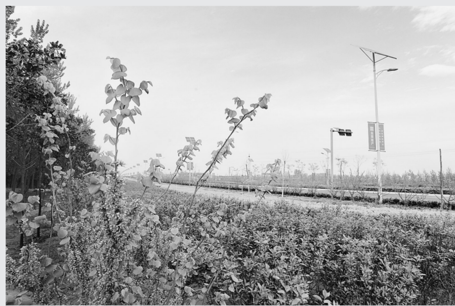
花、草、树相互交织，新郑市民走在这里心旷神怡。

大路成风景，人在画中游。这是新郑市生态廊道建设的真实反映。近日，记者对该市多个生态廊道建设工程进行走访，所到之处，群众纷纷表示生态廊道已经改变并融入了他们的生活，身边多了一道又一道美丽的风景。