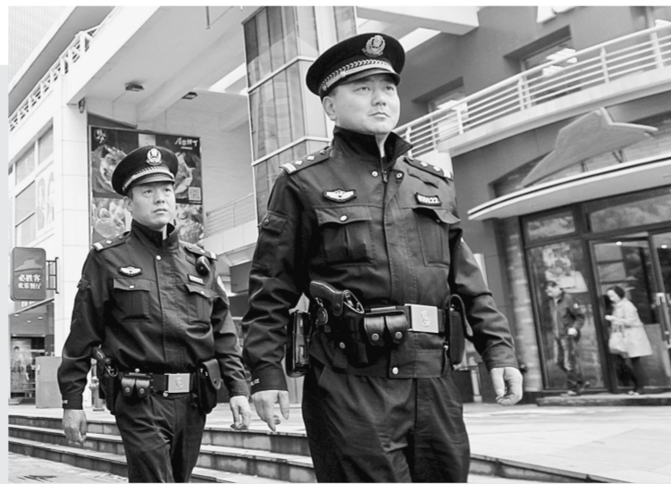
4月20日,上海华阳路派出所民警配枪在街头巡逻。当日上午7时起,在上海市公安局统一指挥下,全市首批千余名基层巡逻民警开始配枪巡逻执勤,震慑和打击各类现行违法犯罪行为。据介绍,此次所有配枪民警已全部通过政治、技能和心理考核。

中国政法大学政法宣传与舆情研究中心研究员金中一称,多年来,全国纷纷推行综合执法,这样执法带来的负面效果已经非常明显。要改变这样的局面,应改革执法机制,分设权力制衡,明确城管执法权限、暴力执法的约束和应对机制,城管内部的身份管理体制。