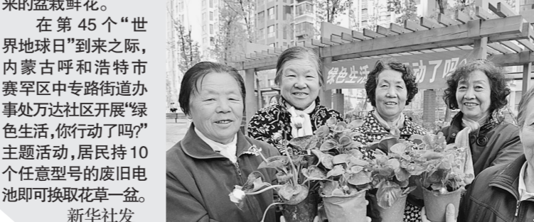
4月20日,社区居民展示用废电池换来的盆栽鲜花。在第45个“世界地球日”到来之际,内蒙古呼和浩特市赛罕区中环路街道办事处万达社区开展“绿色生活,你行动了吗?”主题活动,居民持10个任意型号的废旧电池即可换取花草一盆。