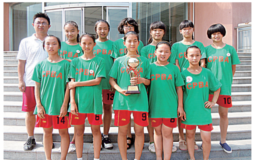
二七区幸福路小学荣获第24届全国U13“苗苗杯”篮球赛女子组冠军等多种奖项

彩张扬的平台,让孩子们尽享篮球的快乐、友谊、激情和幸福成长,也让二七篮球文化与大平台融合,让“校园篮球”运动相互影响,让“多彩教育”有了