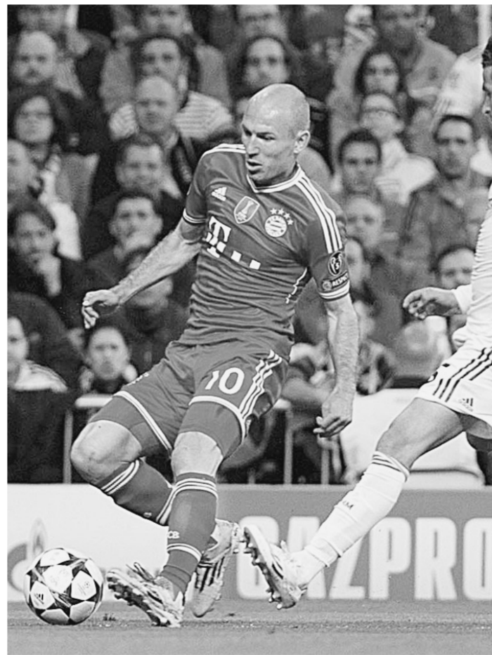
4月23日,拜仁队球员罗本(左)在比赛中突破。当日,在欧洲足球冠军联赛半决赛首回合比赛中,西班牙皇家马德里队主场以1:0战胜德国拜仁慕尼黑队。新华社发

4月22日,双方教练在比赛前相互致意。当日,西班牙马德里竞技队主场以0:0战平英格兰切尔西队。新华社发