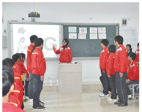
惠济一中学习小组展示

造完整的人。在提高课堂效率，减轻学生负担，注重培养“人”的同时，学校还重视发展学生的个性特长，开发各类校本课程，满足不同学生的个性需求，使学生全面发展和个性发展相结合，拓宽学生生命技能，提升学生生命质量，为每一位学生的终身幸福奠定坚实的基础。