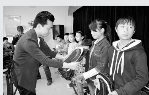
昨日,管城回族区红十字会举办“成长路上你我相伴”扶孤助学活动,辖区爱心企业和爱心人士捐赠善款11100元,用于资助辖区20名特困孤残儿童。

据了解,五一公园爱心书架是由中原区图书馆和河南省工人文化宫联合设立的,最早中原区图书馆把去年联合本报组织开展的“汇聚社会爱心,关爱留守儿童”活动中市民捐赠的部分图书放到书架上,没想到不经意的行动,聚集了更多的爱心,如今五一公园志愿者服务站图书已增加到2600多册。