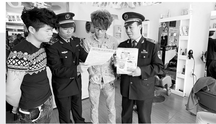
昨日,文化路办事处城管七中队的队员们,对辖区内重点道路的沿街业主赠送便民联系卡。通过宣传、规劝、引导等人性化执法方式,让沿街店铺自觉规避占道经营、跨门经营以及乱堆物、乱吊挂等顽疾。