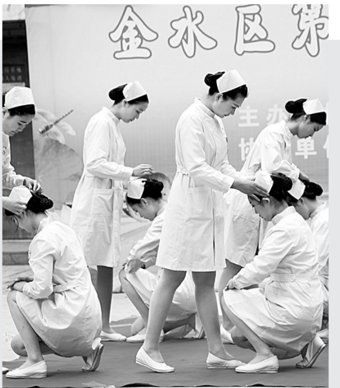
昨日下午,金水区第二届志愿者才艺比拼大赛在金城国际小区举行。平安金水志愿者联合会、爱心联盟志愿者联合会的200余名党员志愿者、网络青年志愿者和社会志愿者同台竞技,展示志愿服务的一技之长。

方顶村中的明清古街是目前郑州境内发现的面积最大、规模最大、保存较为完整、距市区最近的一处明清时期传统民居建筑群,代表了中原独特的乡土建筑文化,真实反映了中原地区明清以来乡村的街道布局、建筑风格、历史风貌和周边环境,具有丰富的历史、科学、社会、艺术等价值。古街中古建筑、古遗迹总面积10000多平方米,有成体系院落43家,较为完整的建筑院落有13家。现存古迹有赵东阶碑、方氏先祠匾、家庙碑、字庙条脊、戒赌碑、禹巡濠门前的一对石狮等。历史名人有赵东阶、方兆凤、方子美等,传统风俗有社火、火神会、坟会、绑灯笼等。