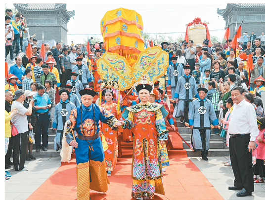
上图 康百万庄园上演的实景剧带领游客跨越时空,体味历史的穿越。