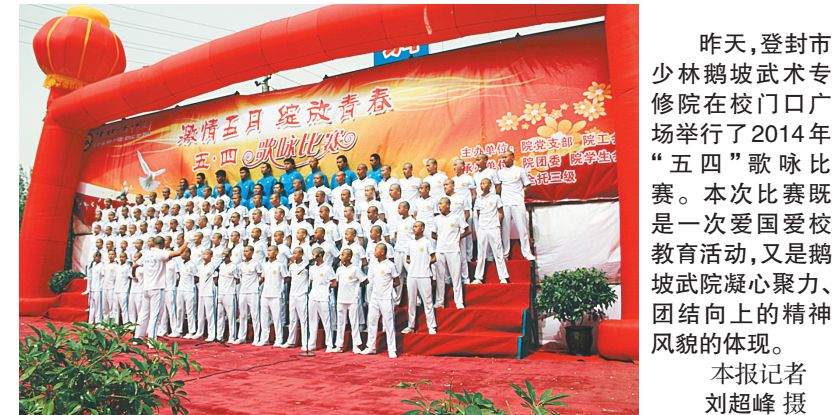
昨天,登封市少林鹤坡武术专修院在校门口广场举行了2014年“五四”歌咏比赛。本次比赛既是一次爱国爱校教育活动,又是鹤坡武院凝聚力、团结向上的精神风貌的体现。

据了解,参加本次比赛有26支球队,来自全省7~11岁的小球员共300人,分成甲乙两个组进行角逐。为了提高小球员们对足球的兴趣,比赛还安排夜场进行,同时组委会利用比赛间隙聘请专家对教练员进行业务培训。