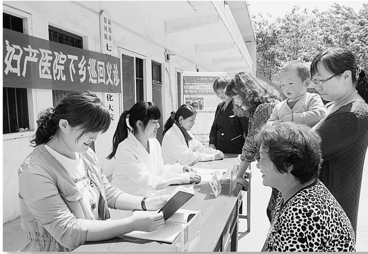
党的群众路线教育实践活动开展以来,新郑市各级部门立足本职、扎根基层,把为群众谋福利作为第一要务,尽心做好人民群众的“服务员”。图为该市梨河镇计生办携手新郑妇产医院下乡为群众巡回义诊。

民生为本,服务为先。为认真做好工伤保险各项工作,新郑市社保局专门制作办事流程图、参保明白卡上门服务;开通农民工、建筑企业参保“绿色通道”;定期到企业开展工伤预防培训;组织企业参加免费职业健康体检,提升工伤预防影响力,维护了企业职工权益。截至4月底,新郑市工伤保险参保人数已达51890人,共计征收工伤保险基金5304万元,已累计发放工伤待遇1283人次,金额达1467万元。