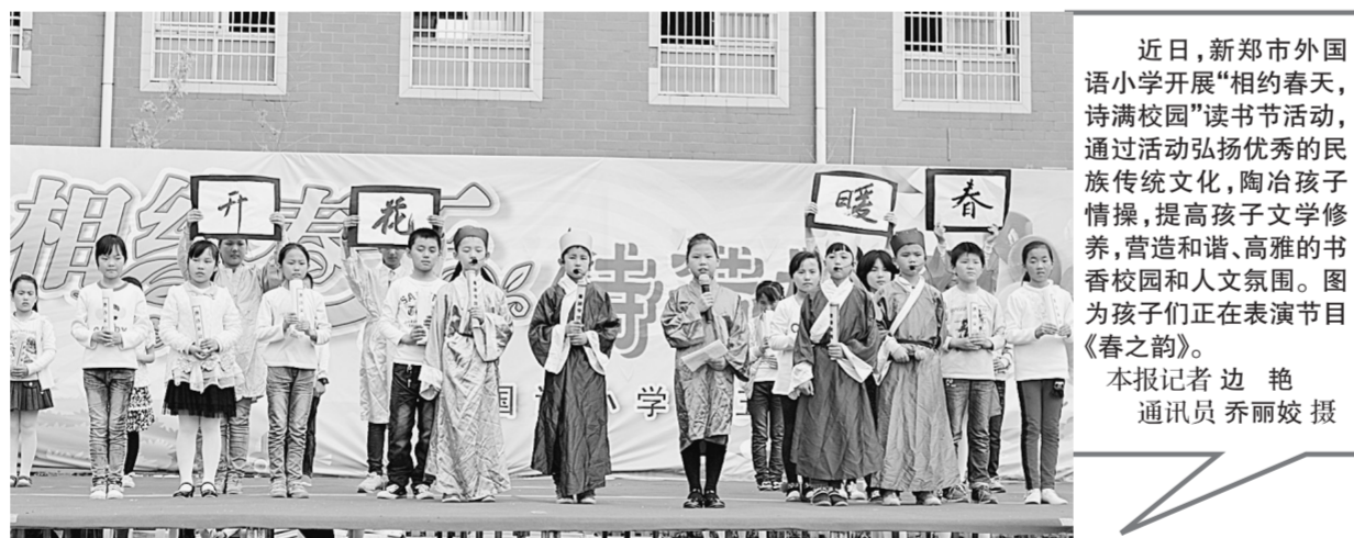
近日,新郑市外国语小学开展“相约春天,诗满校园”读书节活动,通过活动弘扬优秀的民族文化传统,陶冶孩子情操,提高孩子文学修养,营造和谐、高雅的书香校园和人文氛围。图为孩子们正在表演节目《春之韵》。