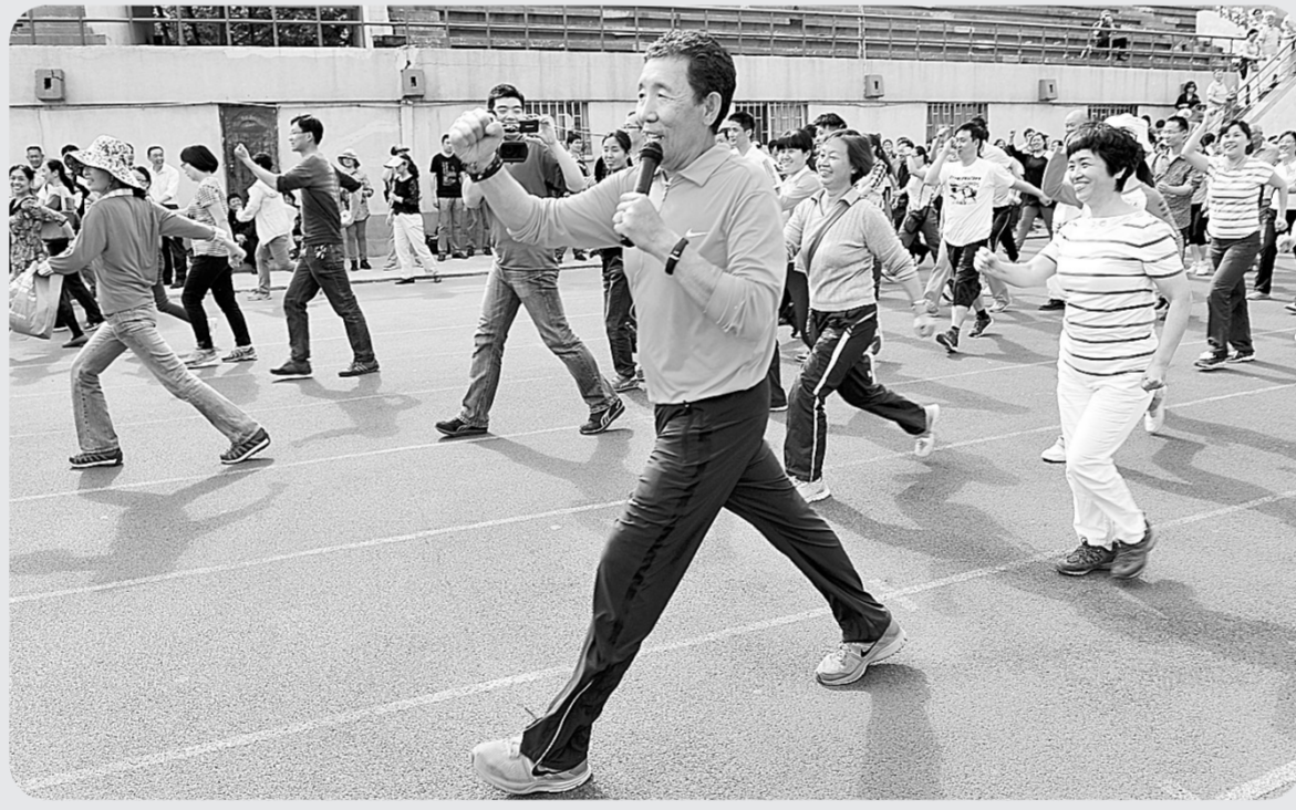
昨日,市中医院、市科协在五·一公园举办“健康运动千人行”广场训练活动,邀请国内知名运动健康专家赵之心向市民介绍步行锻炼对身体的好处,指导市民科学锻炼,增强体质。