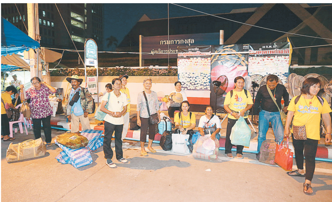
5月22日,在曼谷,反政府示威者停止集会,准备撤离。陆军司令巴育宣布政变后成立“全国维持和平秩序委员会”,委员会命令不同政治派别的示威人群停止集会,各自回家。截至目前,在曼谷市郊的“红衫军”,以及在总理府附近和乍瓦塔那政务中心集会场地的反政府示威者已经开始收拾物品,陆续撤离。