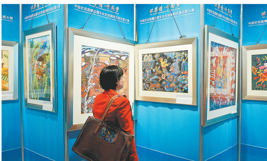
5月21日,参观者在联合国总部举行的“世界情·中国梦”中国农民画精品展上观看画作。