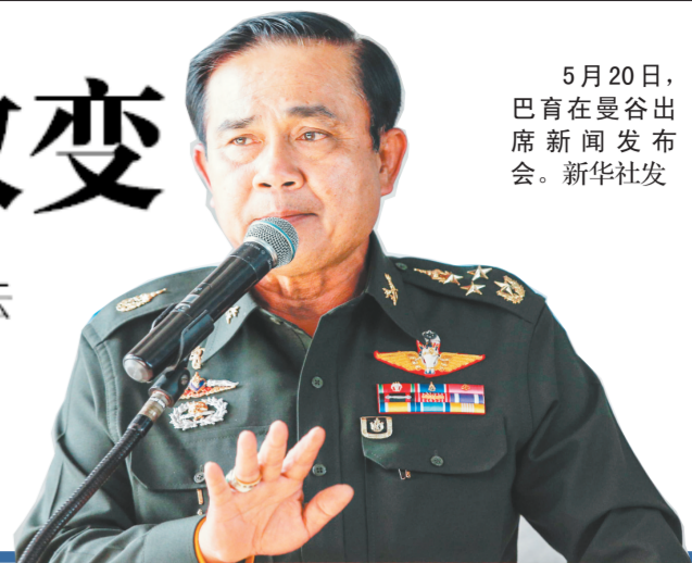
5月20日,巴育在曼谷出席新闻发布会。

泰国陆军司令巴育·占奥差22日发表全国电视讲话,宣布于当天16时30分(北京时间17时30分)发动军事政变,推翻看守政府,接管国家政权,逮捕政治斗争两派的主要领导人,占据主要政府机构。军方说,政变是为了尽快恢复社会秩序,推进政治改革。泰国军方22日宣布,从晚10时至次日早5时在全国范围内实施宵禁。