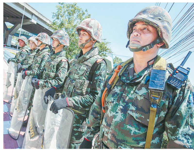
5月22日,在曼谷,泰国士兵在多方会谈的会场外警戒。