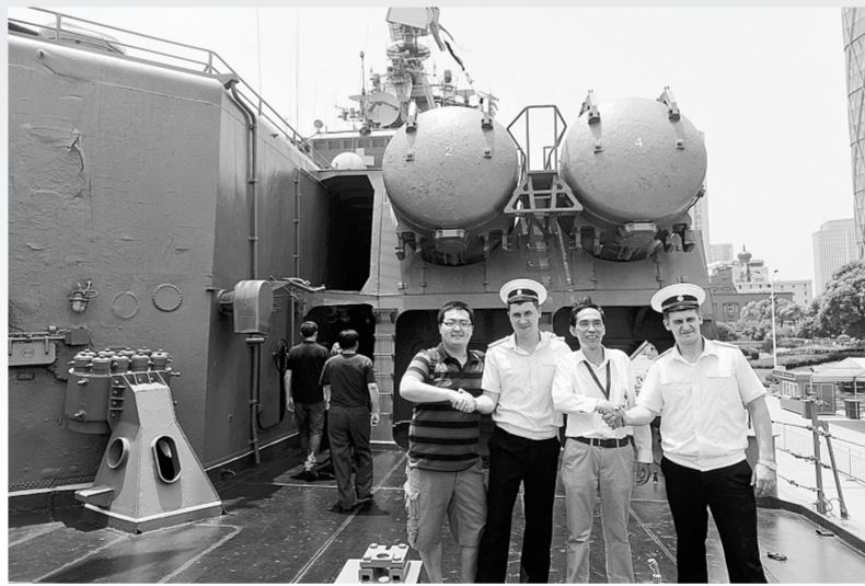
参观者在“瓦良格”号导弹巡洋舰上与俄罗斯水兵合影。

据新华社上海5月26日电 26日上午，上海国际客运中心码头，战舰昂首，人头攒动。刚刚结束中俄“海上联合—2014”军事演习的中方指挥舰郑州舰和俄方指挥舰“瓦良格”号导弹巡洋舰，悬挂着代表节日最高礼仪的满旗，迎接前来参观的人们。9时整，参观正式开始。双方官兵军容严整，整齐列队于各自舰艇的舷梯口。舰上每一处对外开放的参观点，都配备有讲解员，为观众作认真而仔细的介绍。2013年服役的郑州舰是国产第三代导弹驱逐舰，被誉为“中华神盾”，装备有多套中国自主研发的新型武器装备，配备相控阵雷达和垂直导弹发射装置，性能先进，技术含量高，可单独或协同海军其他兵力攻击水面舰艇、潜艇，具有较强的远程警戒探测和区域防空作战能力。它的服役，大大提升了中国海军舰艇编队的防空能力。“这是我国自主设计制造的新一代导弹驱逐舰……”干净整洁的郑州舰上，官兵热情地为市民们介绍武器装备和舰艇基本情况，大家认真聆听讲解，不时竖起大拇指，连声赞叹。“海军这几年发展很快，希望官兵们履行好职责，维护好海洋权益。”在郑州舰飞行甲板，一位60多岁的老人带着孙子前来参观。老人说，他对中国海军的发展非常关心，同时也借此机会对孙子进行爱国主义教育。与郑州舰相隔不足百米的俄方“瓦良格”号导弹巡洋舰，在阳光下显得特别威猛，巨大的反舰导弹发射系