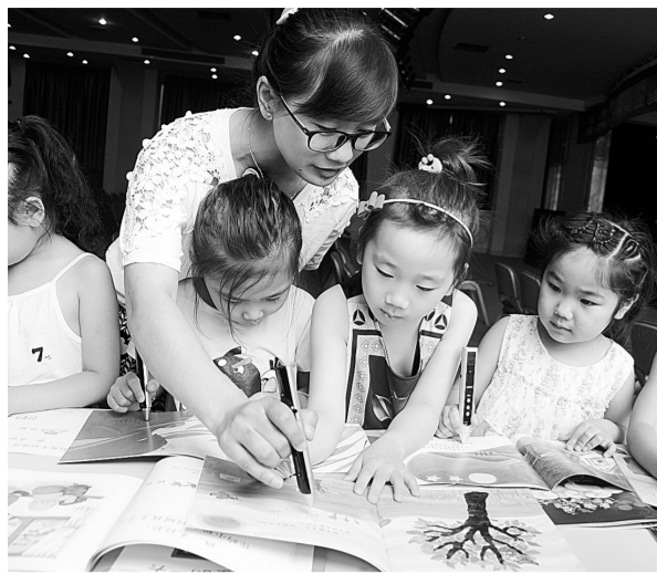
一支笔可以让图书“开口讲话”。