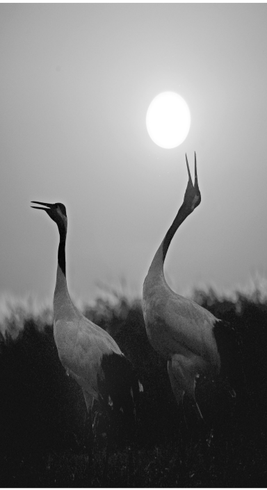
夕阳鹤归