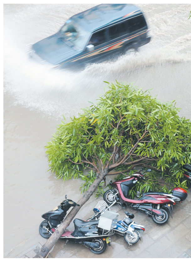
6月17日,在广西上思县东街,一辆汽车涉水经过被风刮倒的道旁树。当日,广西防城港市上思县遭遇暴雨袭击,城区部分路段积水严重。上思县气象局15时18分发布暴雨橙色预警信号。