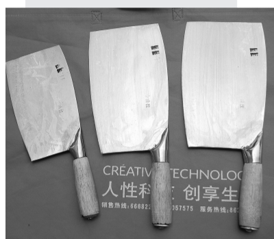
制作成的李记菜刀。

新郑市洧水南岸梨河镇北三里岗村的“李记菜刀”，历经一个多世纪、五代人的不懈努力传承与创新，至今依然闻名遐迩，长盛不衰，而三里岗这个普通的村庄也因独特的菜刀文化声名远播。昨日，记者前往三里岗村，实地了解百年传承下来的“李记菜刀”。