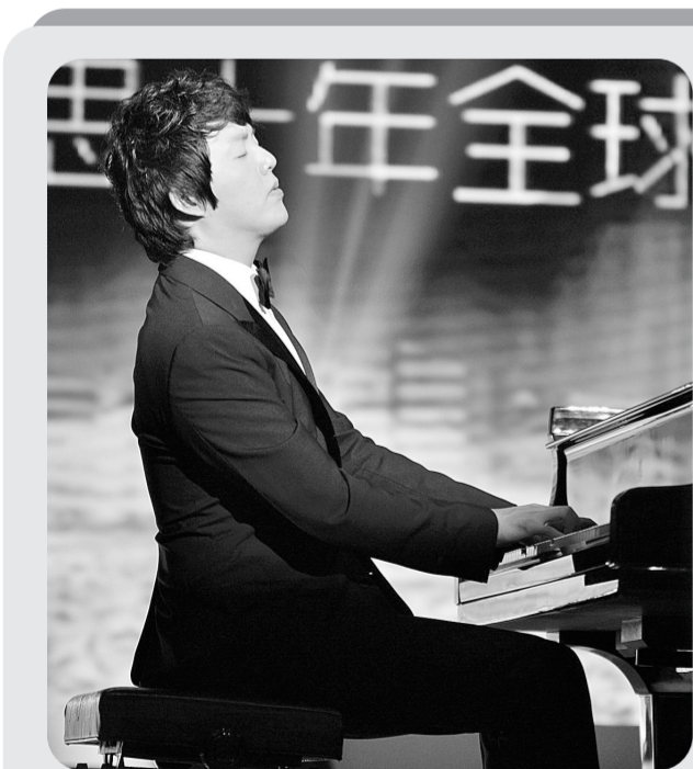
李云迪在庆典仪式上演奏肖邦的《夜曲》

黎志超说,就制作技术来讲,国产动画与进口动画不相上下,然而大多数观众都会认为国产动画远落后于进口动画,其实