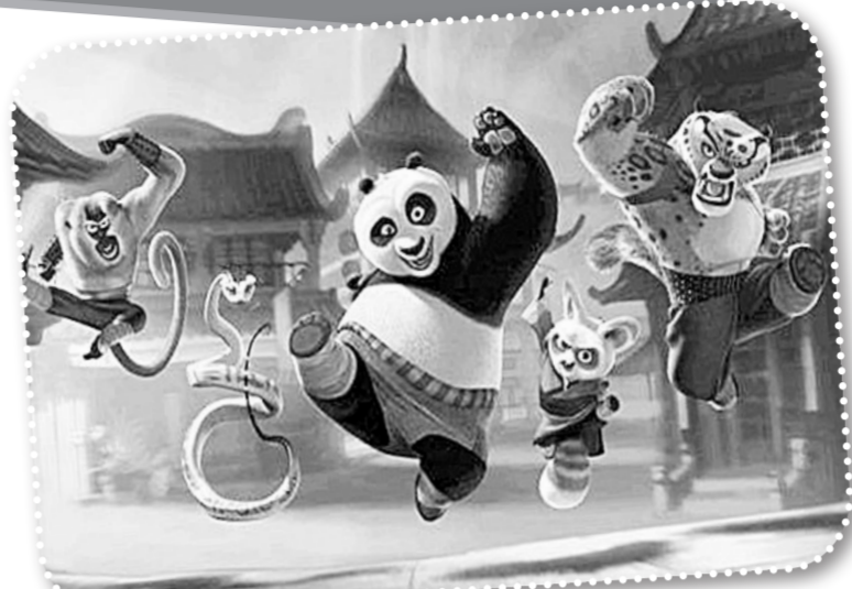
进口动画创意无限

那么,国产动画是否真如这位妈妈所言?家长们对国产动画持何种态度?制作方如何看待家长的评价?连日来,记者采访了家长、国产动画制作方、幼儿教育专家,希望能为家长提供更多可参考的建议。