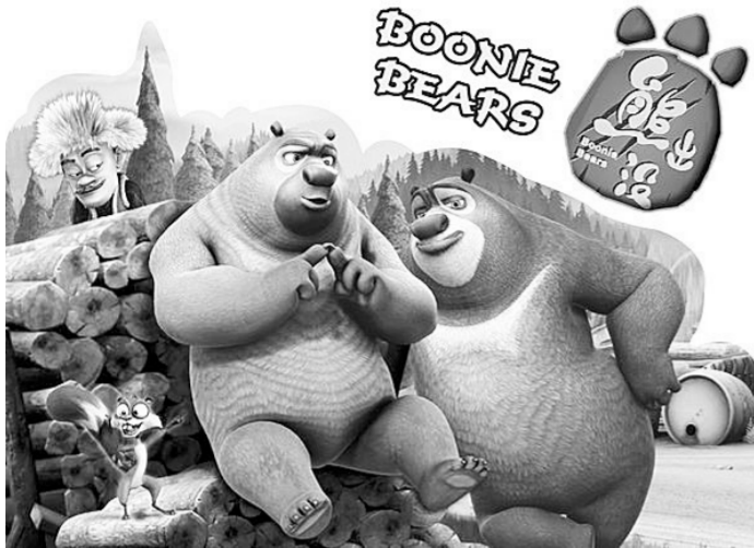
国产动画被批“暴力、低俗”

近日,《一位郑州妈妈怒批国产动画》的文章在网络和微博朋友圈广为流传。文章中,作者痛批诸如《喜羊羊》《熊出没》等动画片“教给孩子的不是爱,不是感恩,不是文明,不是知识,反而宣扬的更多的是暴力、恶俗、无法无天”。文章得到了家长们的热烈回应,转发数万次。