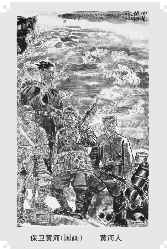
保卫黄河(国画) 黄河人

透过《离骚》,我感受着楚国的历史烽烟和诗人荡气回肠、至诚至美的诗魂。也许会有人哀叹,或沉默,或悲愤,或惋惜,但是我坚信更多的应是心灵的震撼和发自肺腑的敬仰。