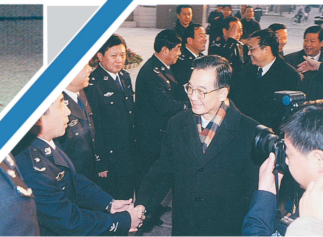
2004年1月21日，温家宝到郑州市公安局看望慰问公安干警。