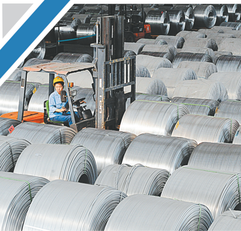
郑州做大做强铝产业。