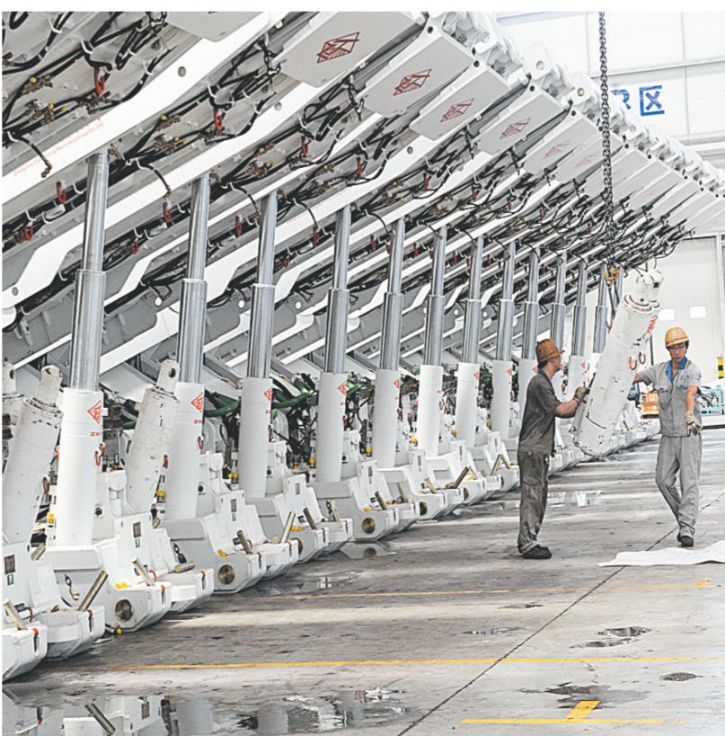
郑州煤机加大新产品的科技含量，走规模化发展之路。

在我市重工业取得良好发展的同时，我市也涌现出了一批龙头企业，享誉业内：郑煤集团创下行业多项第一，恒天重工成为全国纺织机械的领军者，宇通重工成为工程机械制造企业重组的成功范例，新大方成为国内桥梁施工设备第一品牌，中铁装备集团生产出世界上最大盾构机，助力国内外地铁建设。