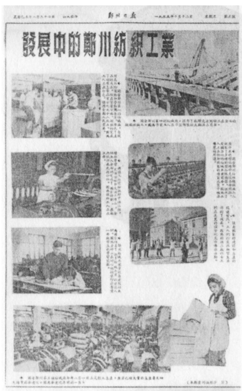
《郑州日报》当年报道棉纺厂的版面。