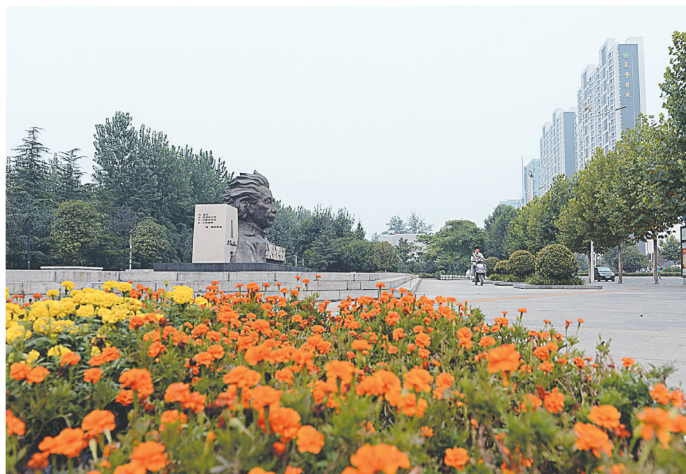
西开发区科学大道繁花似锦。

1988年10月31日<<< 郑州经济技术开发区奠基仪式及第一家合资企业奠基典礼,同时开发区供水厂动工剪彩。