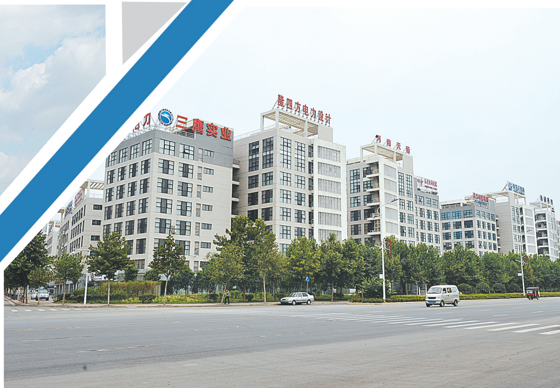
高新区的总部一条街高楼林立。