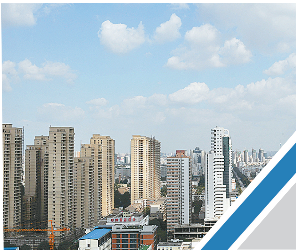
郑州已然成为现代化大都市。