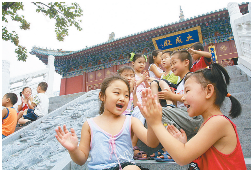
孩子们在文庙里做游戏。

进入新世纪,郑州在实现现代化的道路上不断前进,同时又高度重视历史文化的发掘与传承,希望能够形成自己的文化发展战略,提高城市品位,丰富城市内涵,并以此为契机树立自己的文化品牌,揭示郑州深厚的人文底蕴,为城市发展凝聚力量。为此,2003年郑州市成立了郑州古都学会,结合、借助历史文化研究的成果,对当前郑州城市建设中的诸多问题,如文物遗迹的保护、人文精神的弘扬、老城区环境整治、文化产业发展等进行一些探索,以促进城市全面、和谐地发展。