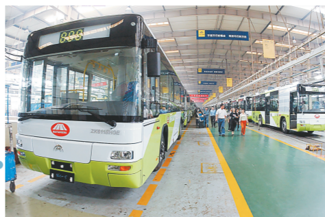
郑州宇通发展迅速。

GDP是反映一个地区经济实力的综合指标。2003年,郑州GDP达到1060亿元,首次跻身千亿俱乐部,成为郑州经济社会发展历史上具有里程碑意义的节点。此后郑州以铿锵的步伐、昂扬的态度,在新世纪的康庄大道上阔步向前,身后留下的,是一串耀眼的闪光足迹。