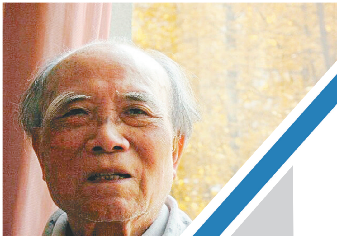
在88年的时光里，魏巍留下的作品，滋养了一代又一代人。