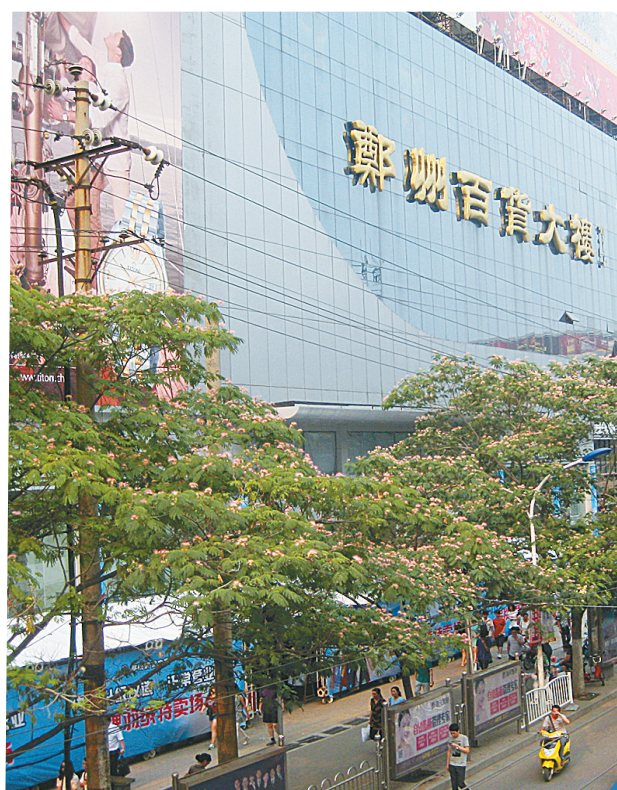
如今的郑州百货大楼从“计划”走向了“市场”，开始迎接新的挑战。

改革开放，加速了商业领域资源整合和业态转型，郑州市手工业大楼也在新一轮竞争中，面临激烈挑战和严峻考验，“腾笼换鸟”已时不我待。1986年以后，二七商圈开始谋划布局，郑州华联商厦、商城大厦、亚细亚商场相继开业，引燃了1989年闻名全国的那场商战。郑州市手工业大楼已不适应时代的发展，1996年12月，进行爆破拆除。