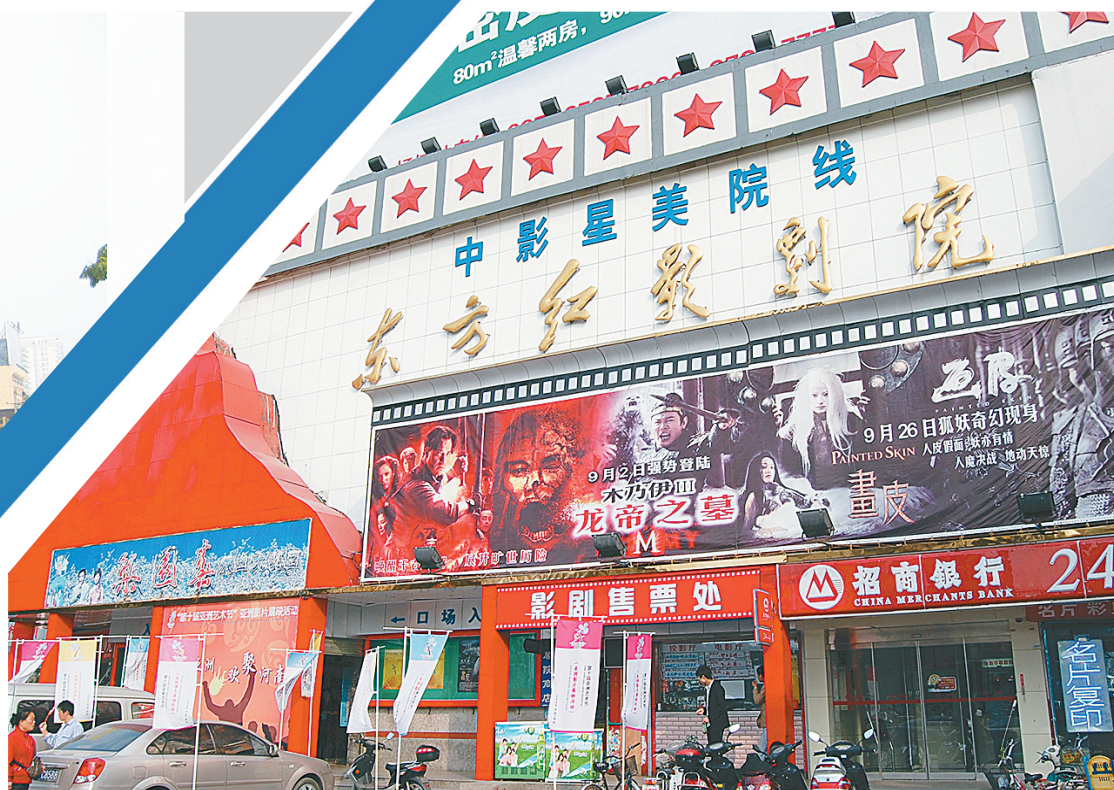
拆除前的东方红影剧院。