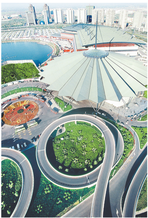
如意湖畔的一颗明珠。

经常在郑州举办，再加上后来的郑交会的举办，郑州会展之城的名声不胫而走。不过后来，由于郑州的展馆建设、展览设施跟不上会展业的发展，在全国的位次不断下滑。