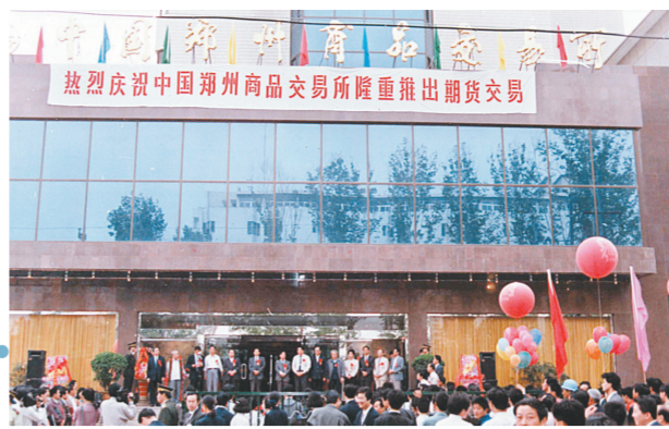
郑商所推出期货交易典礼。

郑州粮食批发市场成立宛如一声春雷，期货市场迅速迎来发展春天。1990年至1993年，国内各类交易所已达到50多家，期货经纪机构达1000多家。 1994年，国务院授权中国证监会进行清理整顿。1995年证监会确定包括郑商所在在内的15家交易所为期货市场试点单位，实行严格限制，期货市场处于低谷。 市场低迷阶段，郑商所交易量占全国15家交易所总成交量的一半左右，支撑了国内期货行业的生存。1998年，国务院再次对期货市场进行整顿，全国15家交易所保留为3家，郑商所成为3家期货市场试点之一。 从2003年开始到2005年，郑商所上市了强筋小麦和棉花两个新的期货品种，成交量和成交额随后逐年上升。如今已上市交易有小麦、棉