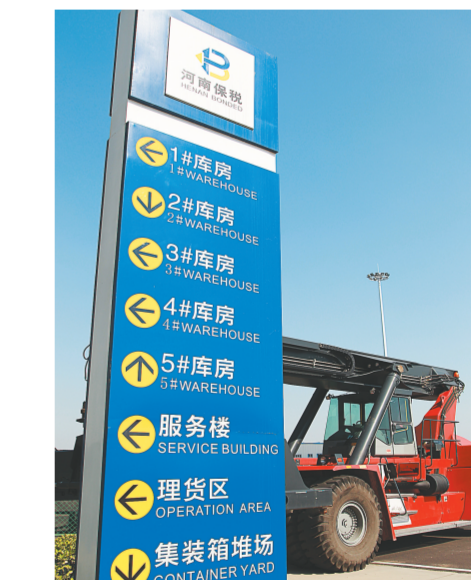
繁忙的保税物流中心。

跨境电商，就像一个渔网，郑州抢占了先机，占领了最具优势的发展海域，那么郑州也就“网”住了越来越多的电商服务平台，越来越多的电商大鳄、物流大咖都会抢滩这块风水宝地。