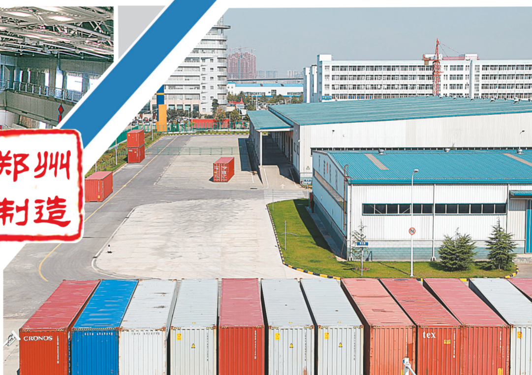
河南保税物流中心。