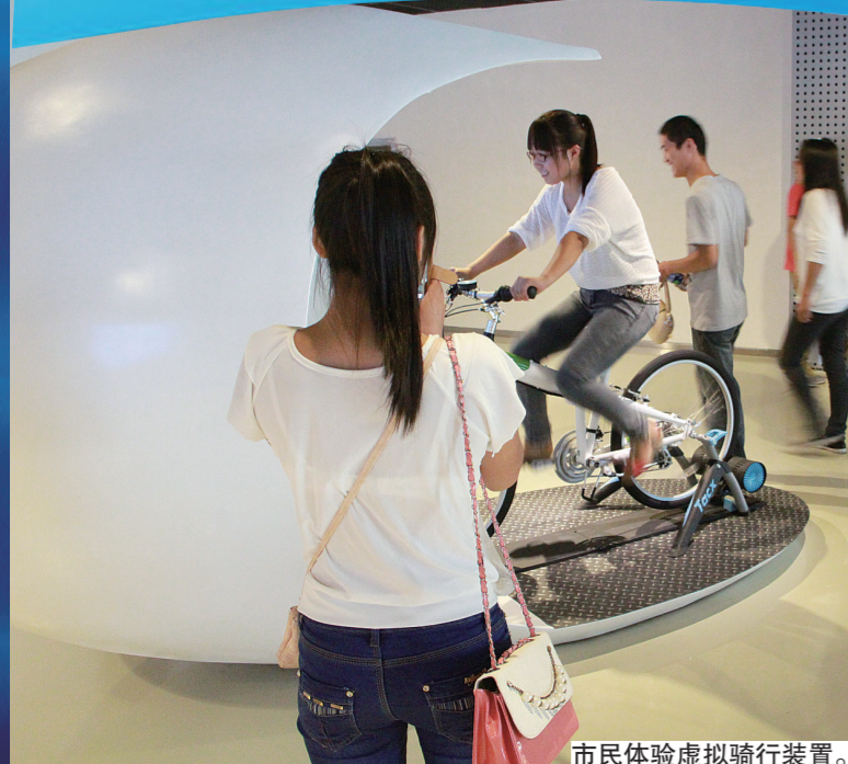
市民体验虚拟骑行装置。

国家知识产权创意产业试点园，已然谱写出惊世华章，更走在继续雕刻美丽画卷的大道上！