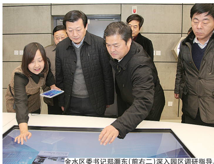
金水区委书记郑灏东(右二)深入园区调研指导。