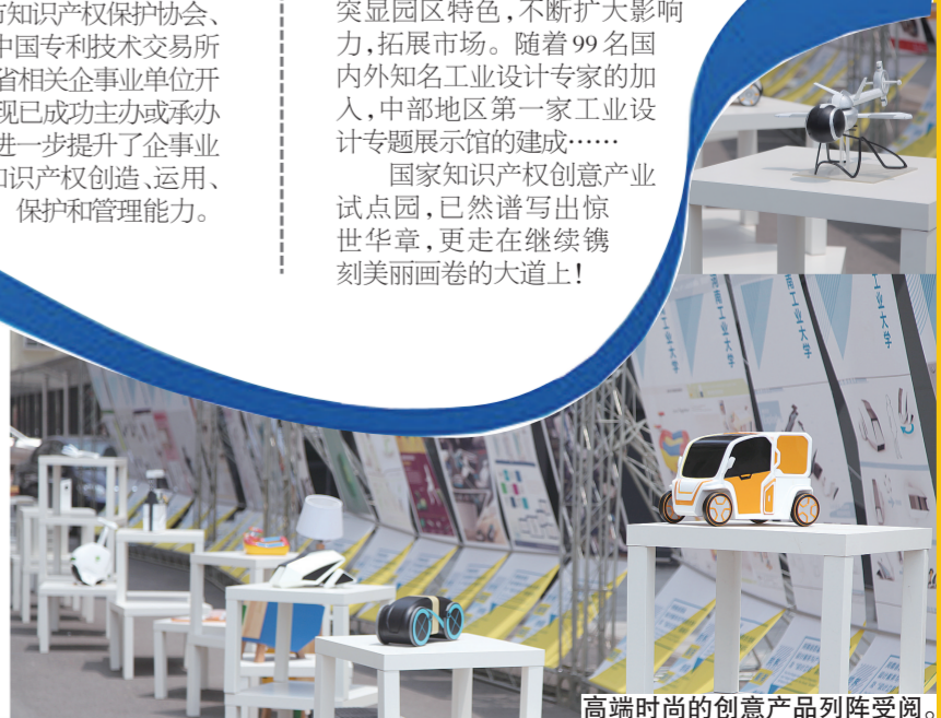
高端时尚的创意产品阵列受阅。