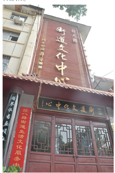
街道即可享受各种服务。街道生活文化中心让群众不出街

组建执法“集团军”。联合食品药品监督管理局、工商管理局、卫生局、房管局、地税局、环保局、派出所等职能部门组建了街道综合执法办公室,自综合执法办公室成立以来,已受理疑难案件上百起,处置解决率达到99.84%。