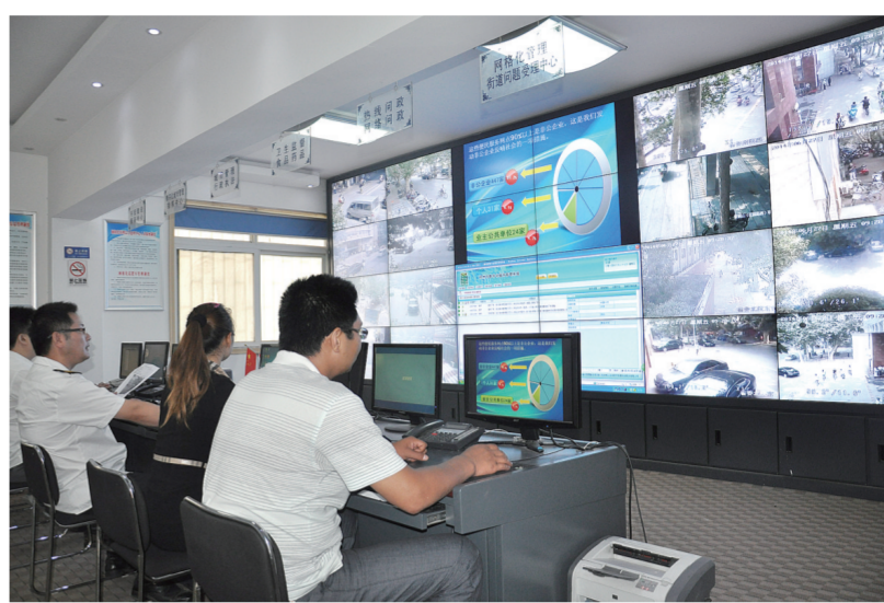
多部门联动、高效运转的信息综合指挥平台。

加快“经八路街道办事处生活文化服务中心”建设步伐。着力打造集家政服务、旅游中介、就业指导、法律援助等为一体的多元化民生服务中心。目前,民生服务大楼内部装修工作已经基本结束,“出行帮帮团”、“我爱我家”家政服务等一批服务机构已经开始入驻。