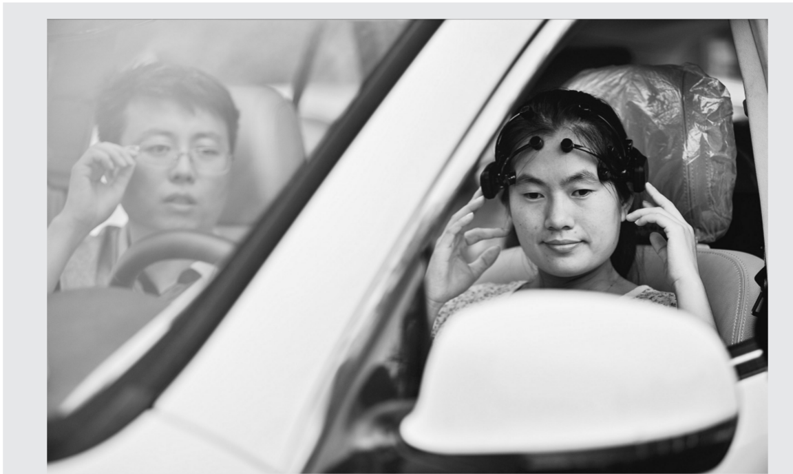
意念开车不再遥远 7月3日,一名参与研发的学生(右)头戴装有感应器的头罩,用“意念”调节汽车后视镜的角度。当日,天津南开大学研究团队,在校园内展示他们最新研发的脑电信号汽车控制系统。在一辆装载着GPS系统、计算机处理系统、车载电子控制单元等装置的汽车中,科研人员

据新华社福州7月3日电(记者 孟昭阳 董建国)近日网上曝出“福建闽侯高考加分抵偿征地款,违规政策实行了12年”。福建省教育厅在接受记者采访时称,“高考加分抵偿征地款”是一种“误解”,并解释了该照顾政策出台的“始末”。 网上相关报道称,在过去的12年里,福建闽侯县上街镇的很多农村考生可以享受被福州地区大学新校区降20分录取的优惠政策,但今年却享受不到,并质疑相关招生政策是否合规? 福建省教育厅向记者解释了此政策出台的背景:2002年以来,考虑到征地村民对福州地区大学新校区建设作出的贡献以及福州市政府的要求,福建省教育厅对征地村民子女报考福州大学城新校区高校,实行特殊录取照顾政策。该政策为“凡是经福州市政府认定的大学城征地农民考生,福建省教育厅单独安排招生计划,对本一批线下20分以内、本二批次线下20分以内,以及部分专科批考生,安排在福州大学城相应批次的高校就读。”此照顾政策的出台和征地款的多少并没有关系,考生招生计划也是单独安排的。”教育厅一位负责人说。 为何已经实行了12年的照顾政策今年却没有了?福建省教育厅向记者解释说,今年教育部出台了专门的文件规范相关照顾优惠政策,根据文件精神,福建决定从2014年开始全面停止此类照顾政策。