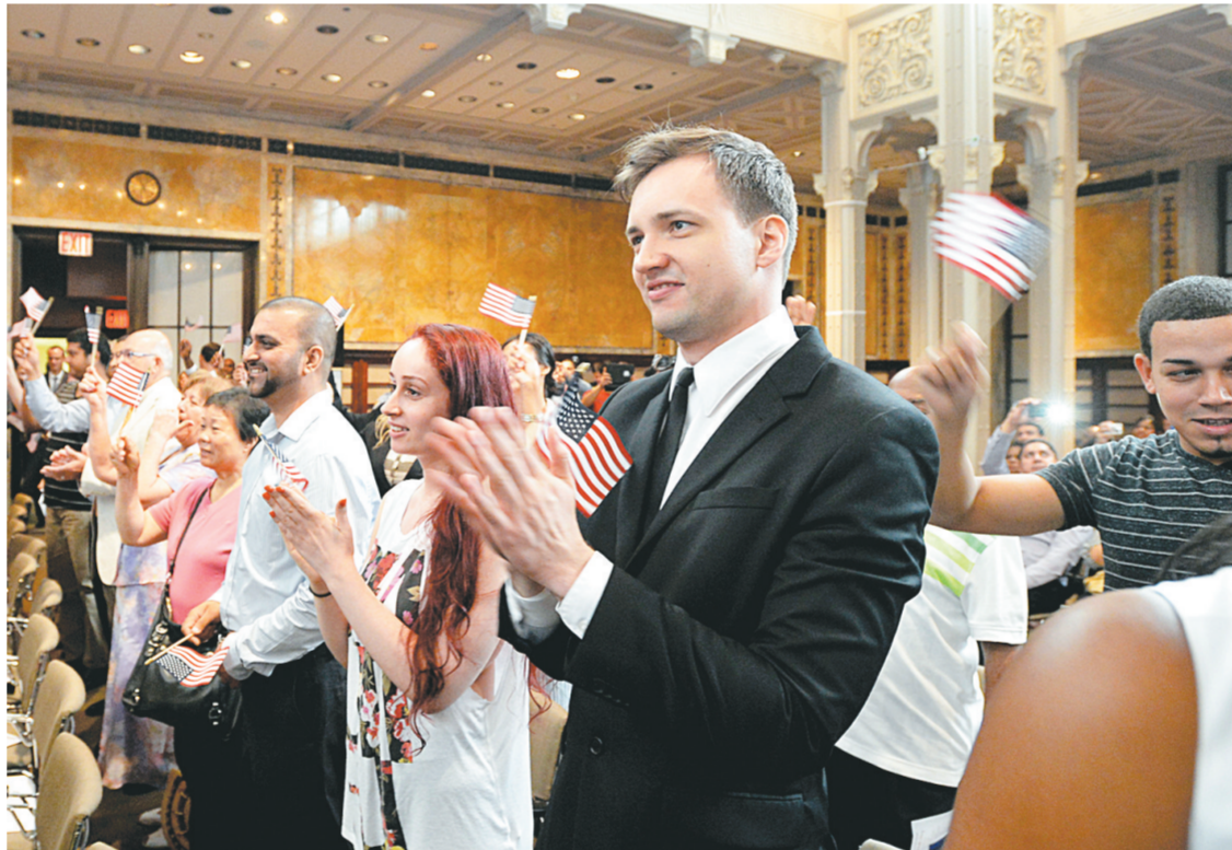
7月2日,新移民在纽约曼哈顿参加公民入籍仪式。当日,美国公民身份和入境事务局在纽约为150名新移民举行公民宣誓与入籍仪式。今年美国独立日前夕,美国公民身份和入境事务局在全国为约7800名新移民举行了超过95场入籍仪式。