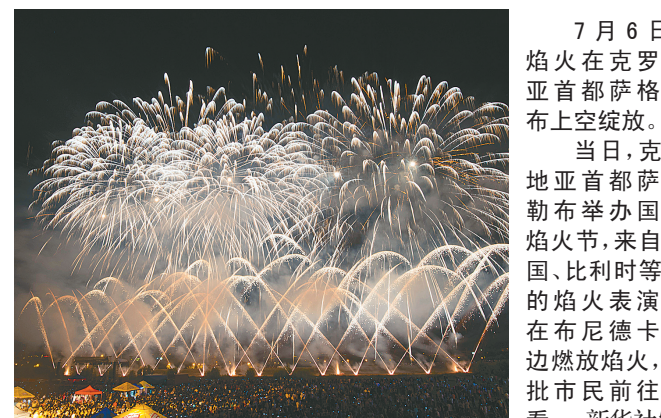
7月6日，焰火在克罗地亚首都萨格勒布上空绽放。当日，克罗地亚首都萨格勒布举办国际焰火节，来自法国、比利时等国的焰火表演队在布尼德卡湖边燃放焰火，大批市民前往观看。