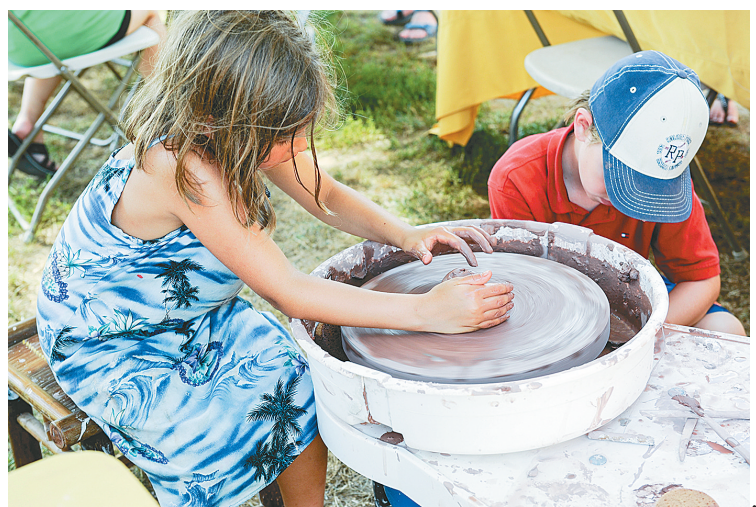
7月6日，在美国首都华盛顿国家广场，一个孩子体验陶艺制作。为期两周的2014史密森民俗节“中国：传统与生活的艺术”主题活动6日在华盛顿落下帷幕。这是中国首次以主宾国身份参加史密森民俗节活动，同时也是近年来中国参与的规模最大、级别最高的民俗艺术对外交流活动，共吸引大约100万美国民众和来自世界各地的游客。