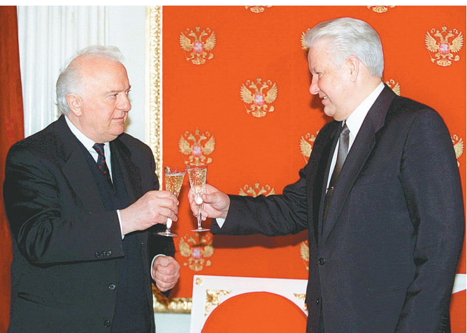
这是1996年3月19日在俄罗斯莫斯科拍摄的时任格鲁吉亚总统爱德华·谢瓦尔德纳泽(左)与俄罗斯总统叶利钦的资料照片。

格鲁吉亚前总统爱德华·谢瓦尔德纳泽7日病逝，终年86岁。谢瓦尔德纳泽1928年1月25日生于黑海沿岸一个农民家庭，20岁加入共产党，1972年出任格鲁吉亚共产党第一书记。1985年，时任苏联领导人米哈伊尔·戈尔巴乔夫任命谢瓦尔德纳泽为外交部长。苏联解体后，谢瓦尔德纳泽成为新独立的格鲁吉亚共和国第二任总统。2003年11月，格反对派指责议会选举存在舞弊，组织大规模示威，发起所谓“玫瑰革命”，谢瓦尔德纳泽被迫辞去总统职务。他担任苏联外交部长期间数次访华，为中苏关系正常化起了积极作用。