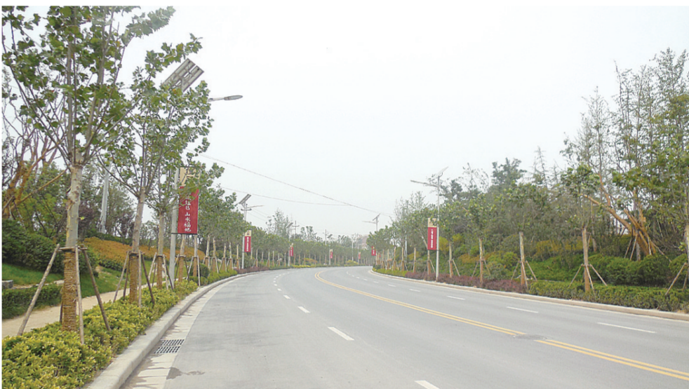
镇区通往社区的道路

在农业方面,大力实施了优质粮工程,把祖始等四个村建设成优质小麦生产专业村。积极发展休闲观光的现代高科技农业。在楼李村建设1300亩的荥阳万宝生态循环产业园,一期占地500亩,建设有6.5万平方米的智能连栋温室和9000平方米的日光温室,种植有各种水果以及160多种蔬菜,建设循环式鱼塘6600平方米、农家餐馆等配套服务项目。在洞林湖社区规划建设面积700余亩的设施农业观光园,集采摘、婚纱摄影、风味农家餐厅、农耕文化等为一体,一期建设170余亩的