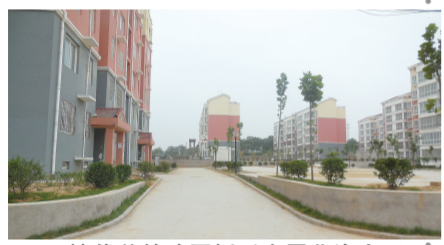
环境优美的路网拆迁安置北沟小区

2012年定为郑州市新型城镇化建设新市镇以来,贾峪镇紧紧围绕“三大主体”战略部署,以网格化管理为载体,坚持“依靠群众推进工作落实”长效机制建设,充分发挥区位优势,坚持发展与转型互为促动,全域推进新型城镇化建设,着力推进产业结构优化升级。截至目前,累计投入资金15.79亿元,完成拆迁面积32.54万平方米,建设安置房69.61万平方米,在建安置房11万平方米,回迁群众约2171户,8553人;完成道路建设41.73公里,廊道建设31公里,初步形成了“三化”协调发展的良好态势。2012年、2013年连续两年被评为郑州市新型城镇化建设“十快”乡镇。