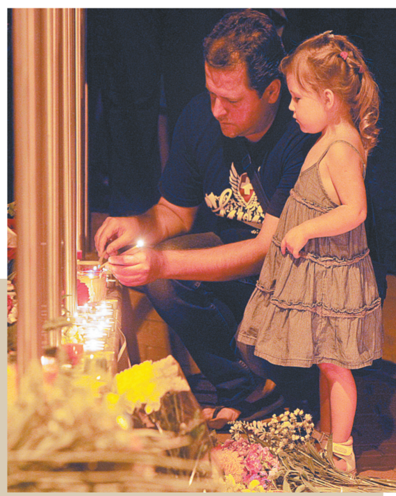
→7月17日,在乌克兰首都基辅,人们来到荷兰大使馆点燃蜡烛,向失事马航MH17航班遇难人员表示悼念。