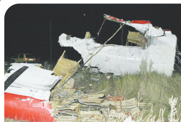
↑这是7月17日在乌克兰东部地区拍摄的失事客机残骸。

调查局已成立专门委员会调查坠机事件,委员会成员已前往事故地点。荷兰将派调查组前往乌克兰。联合国安理会18日举行紧急会议并通过声明,要求对马航MH17航班坠毁事件展开“全面、独立、国际性”的调查,呼吁所有有关方面立即准许调查人员前往坠机现场,调查事故原因。