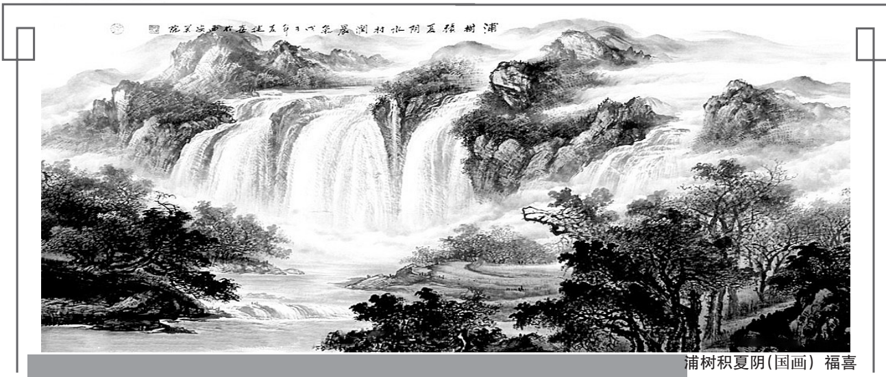
蒲树积夏阴(国画) 福喜

后来,村里人都纷纷外出打工了,山上那些果树也没人管理了。我家的果园也一样,干不了重活的父亲也不再管理那片果园了,没人管理的果树一天天就被杂草覆盖,有的枯死了,有的懒懒地长在地里。相反的其他其他的树也长