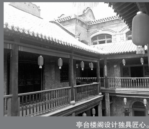
亭台楼阁设计独具匠心。